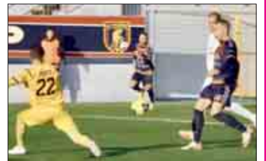
Un momento della gara d'andata tra Potenza e Brindisi e a destra uno di Picerno-Virtus Francavilla giocata ieri pomeriggio al Curcio