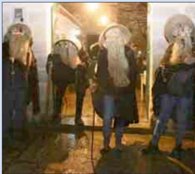
I visitatori e le maschere dei Cucibocca

cerimonia che trae origine nel calendario ortodosso - bizantino, nel quale è celebrato San Simeone Lo Stilita, la cui caratteristica è rappresentata proprio da una catena