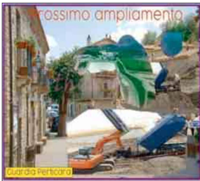
I fotomontaggi realizzati dal comitato

"Il Paur viene impugnato davanti al Tar di Basilicata con due distinti ricorsi da parte del Comune e del comitato civico più sette cittadini, a cui si aggiunge il Wwf con un intervento ad adviantum. Il Tar di Basilicata ricorda il comitato - respinge entrambi i ricorsi ed esclude il Wwf, in quanto non è dimostrato l'interesse che intendono tutelare. Per il Tar di Basilicata, le evidenti violazioni di legge da parte degli uffici regionali, vengono considerati come "determinazioni rientranti nell'ambito della discrezionalità tecnico amministrativa, sottratta al sindacato di legittimità". Singolare è l'interpretazione dell'acquisizione dei pareri all'interno della conferenza dei servizi, a seconda le parti che la richiedono, e con tre diverse decisioni