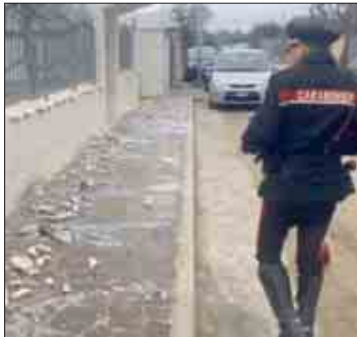
Il sopralluogo dei carabinieri ieri mattina sul posto