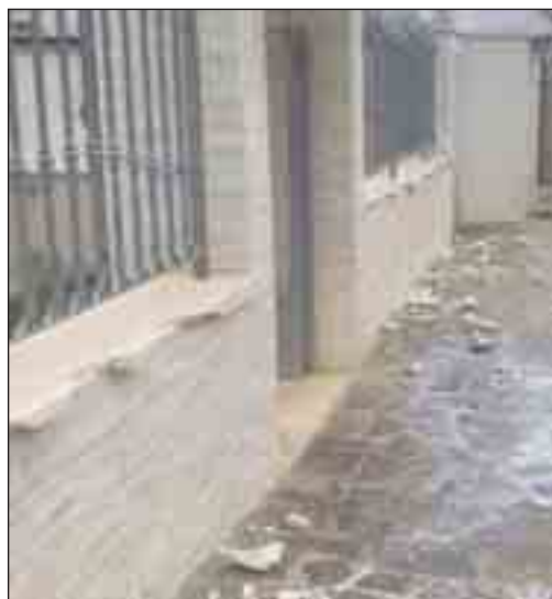
I rilievi eseguiti sul posto dai carabinieri ieri mattina