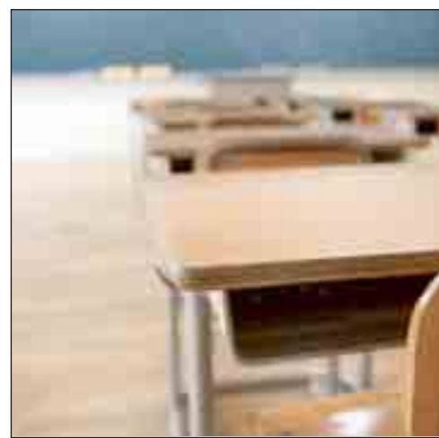
Un'aula scolastica. Polemiche dai comuni e dai presidenti delle Province